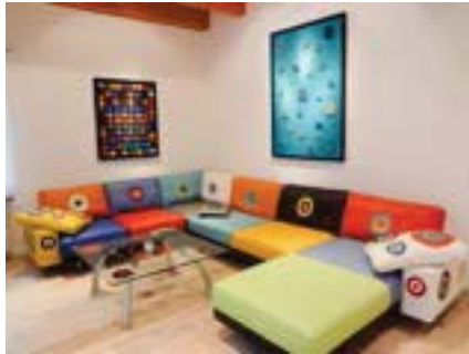
Dieses teure Designerstück war in die Jahre gekommen - nun erhielt es eine einzigartige Bisenz-"Lederhaut" und ist ein Hingucker in jedem Wohnambiente.

produktion. Die Partnerfirmen, die meine Designs umsetzen, müssen ein feines Gespür und auch einen Sinn für Kunst haben. Alles ist verlässlich von Handwerksmeistern hier in der Gegend angefertigt. Den Ka-