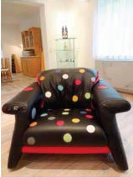
Der Ledersessel "Konfetti Night" ist ein heiteres Feuerwerk aus Farbe - zum Wohlfühlen.

produktion. Die Partnerfirmen, die meine Designs umsetzen, müssen ein feines Gespür und auch einen Sinn für Kunst haben. Alles ist verlässlich von Handwerksmeistern hier in der Gegend angefertigt. Den Ka-