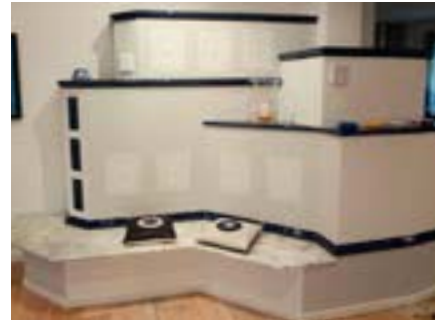
Wer möchte nicht auf den farblich abgestimmten Bisenz-Lederkissen Platz nehmen und sich an dieser schönen Kachelofenanlage den Rücken wärmen.

Die größte Chance für das österreichische Handwerk sieht Bisenz im hiesigen Einfallsreichtum, gepaart mit der für Österreich typischen hohen Qualität. Derzeit ist der Künstler mit dem Programm "Is Letzte" auf Tour, Details unter WWW.BISENZ.AT